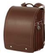
ダークブラウン ×ピンクステッチ