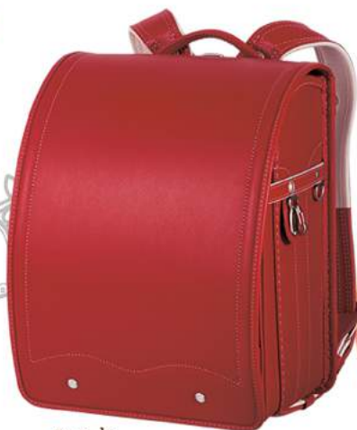
レッド ×ピンクステッチ