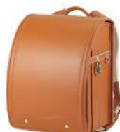
キャメル ×ピンクステッチ