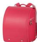
ルビー ×ピンクステッチ