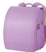
ラベンダー ×ピンクステッチ